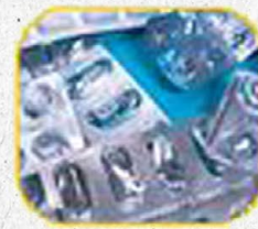
Cartelas de remédios