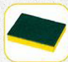
Buchas de lavar louça