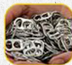
Lacres de latinhas