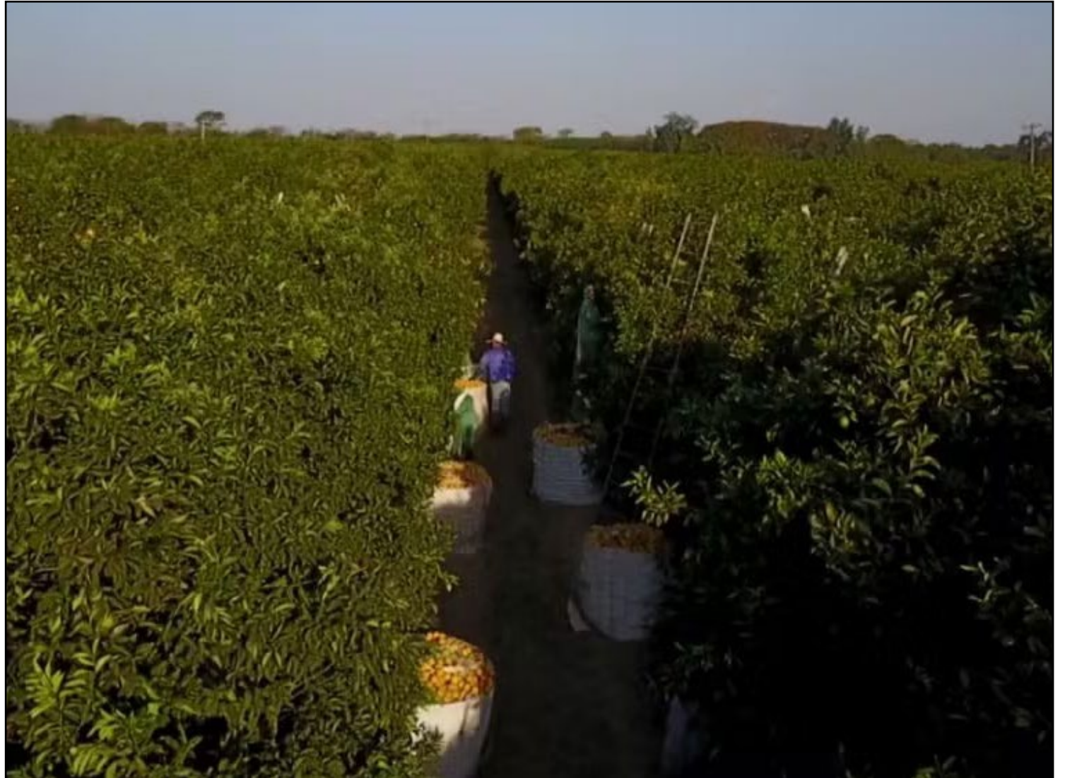
Plantação de laranja com solo seco diante de estiagem em São Paulo

Produtores relatam queda prematura de frutos e prejuízos históricos devido à seca prolongada