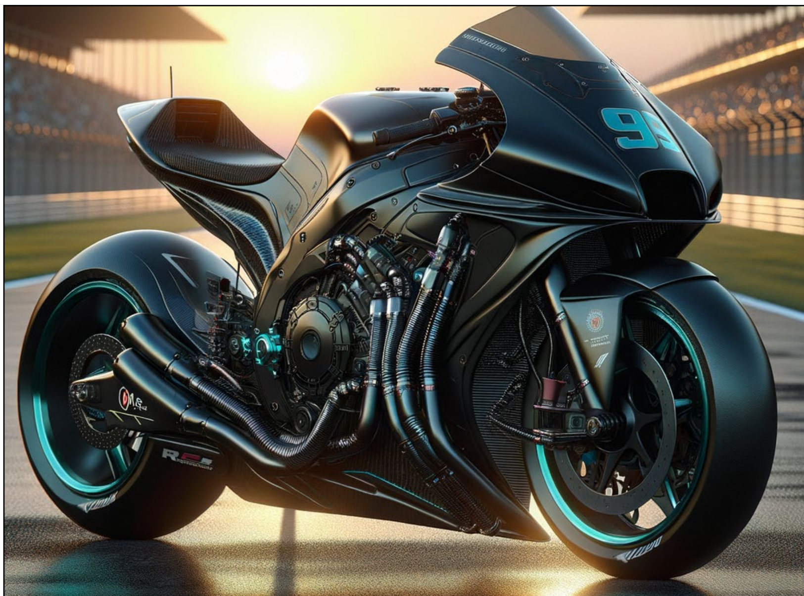
Por fim, a moto da Mercedes AMG. No início do texto, a moto é da escuderia Ferrari.