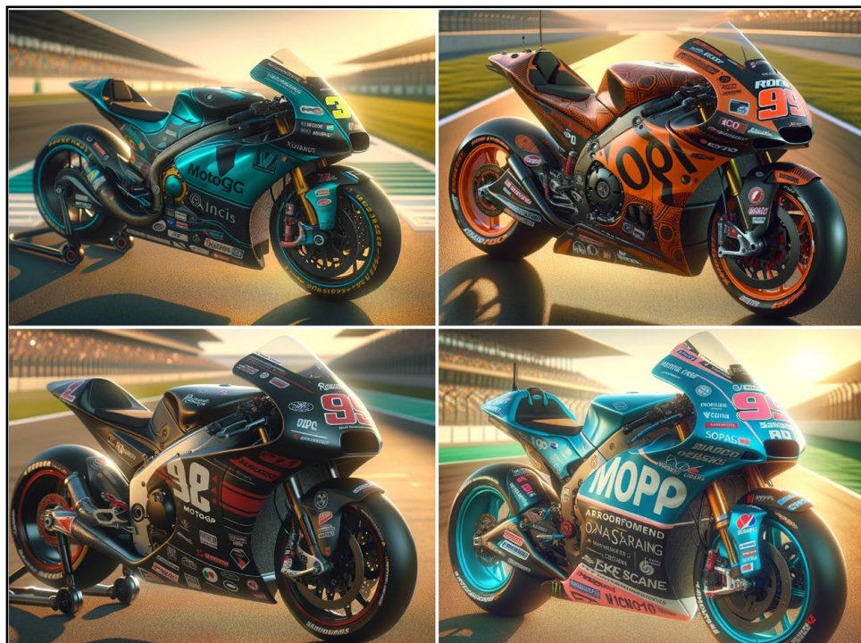
Acima, da esquerda para a direita: Aston Martin e McLaren, Haas e Alpine