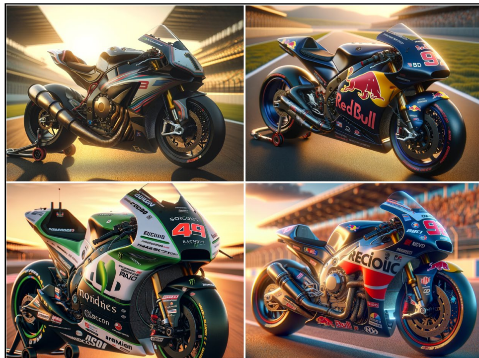
Acima, da esquerda para a direita: Williams e Red Bull, Sauber e RB Visa Cash App