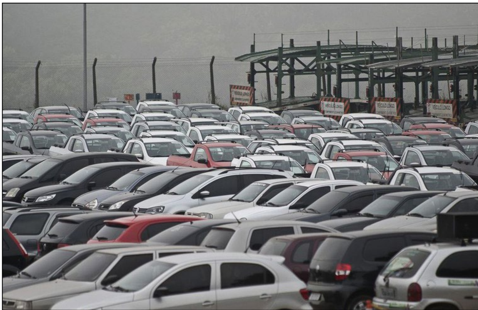
Nove montadoras de automóveis aderiram ao programa.

Trinta e um modelos de carros terão descontos e reduções variam de R$ 2 mil a R$ 8 mil no preço dos veículos de até R$ 120 mil. Para frota de caminhões e ônibus, 19 montadoras aderiram